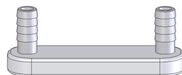
Réacteur Nano-Pro, montage extérieur au tube d'échappement